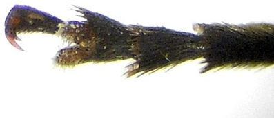
Fig. 3. Metatarso con lóbulos separados

Pronoto algo más largo que ancho en la base, la base ligeramente bisinuada, con pubescencia pardo amarillenta y algunas machas de pubescencia marrón oscura; escutelo triangular, cubierto de pubescencia blanquecina; élitros una vez y media más largos que anchos en conjunto, cubierto de densa pubescencia pardo amarillenta uniforme en las interestrías pares, las impares con pubescencia más clara, casi blanca, en donde se alternan máculas de pubescencia casi negra ofreciendo un aspecto ajedrezado a los élitros. En la mitad de cada élitro, más cerca de la sutura que del borde lateral se observa una mácula redondeada de color casi negro. Abdomen de color pardo oscuro; patas fuertes, con las tibias anilladas de pubescencia clara y oscura y las uñas fuertemente bífidas en las hembras (Fig. 4), sólo ligeramente en los machos (Fig. 5). Tercer tarsómero de todos los tarsos con lóbulos separados.