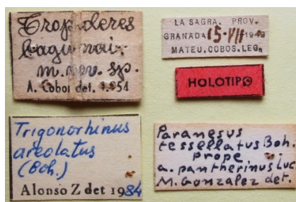
Fig. 13. Etiquetas del Holotipo de Tropideres baguenai Cobos