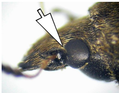
Fig. 2. Escroba antenal