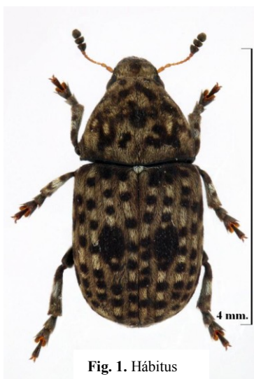
Fig. 1. Hábitus

Sistemáticamente el género se encuentra incluido en la subfamilia Anthribinae Billberg, 1820, tribu Trigonorhinini, Valentine, 1999, junto a los Opanthribus Schilsky, 1907 con los que comparte la forma de la escroba antenal (Lompe, 2002). Precisamente por este carácter de la escroba antenal, aparte de los tarsos con lóbulos separados, se separa de los Anthribus Geoffroy, 1762, en los cuales la escroba no toca el ojo y los lóbulos tarsales están unidos; por lo demás, Anthribus y Trigonorhinus son muy cercanos en su morfología externa.