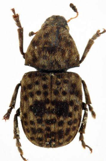
Fig. 12. Holotipo de Tropideres baguenai

Verdugo, A., Recalde Irurzun, I. & Sanmartín Moreno, A. F. Nuevo registro de Trigonorhinus areolatus (Boheman, 1845) para la provincia de Cádiz, España y datos sobre su morfología y biología (Coleoptera: Curculionoidea: Anthribidae).