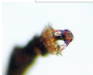
Fig. 4. Uñas de la hembra