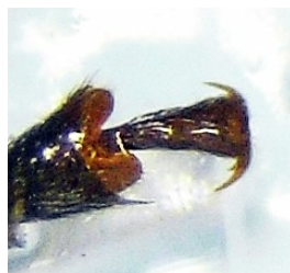
Fig. 5. Uñas del macho