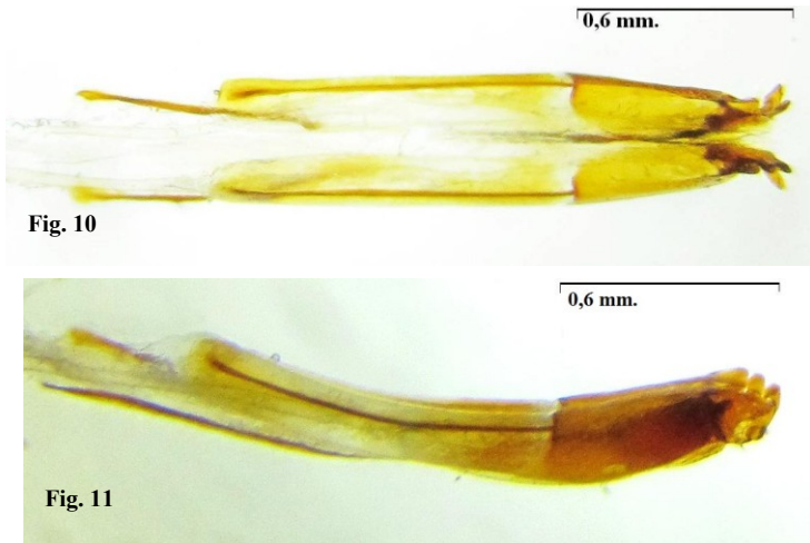
Figs.10-11. Ovipositor de Trigonorhinus areolatus . 10. Vista dorsal; 11. Vista lateral.